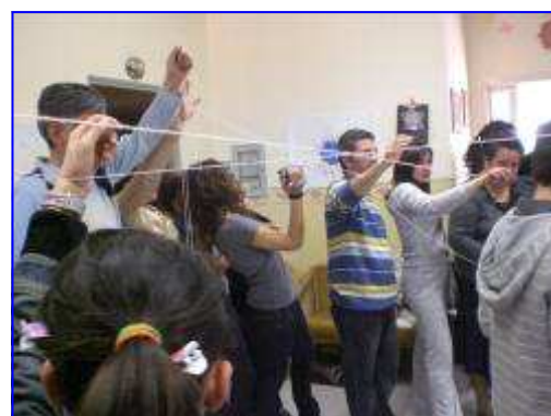
Alcuni dei momenti vissuti alla Casa alloggio