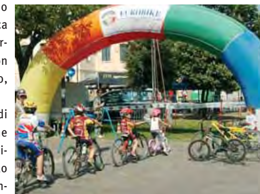
Didattica e divertimento con la bike school

Per la seconda edizione di Bikenergy le piazze cittadine saranno invase da colori, vivacità e grande energia: dallo SportExpo alla mezzanotte bianca, fino alla competizione e alla bike school dedicate ai bambini.