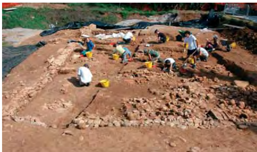
L'area degli scavi archeologici a Posmon

La realizzazione di un parco archeologico sarebbe quindi estremamente importante per la Città anche sotto il profilo turistico visto che ormai la Montebelluna antica è conosciuta al di fuori dei confini regionali.