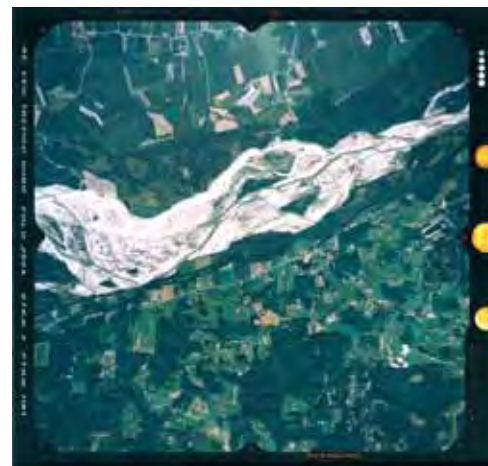
Foto aerea dell'alveo del Piave consultabile attraverso il software GIS del centro di documentazione del Museo

Grande peso hanno avuto le indagini geoarcheologiche realizzate nel sito di Via Cima Mandria a Posmon dove fino ad ora sono state effettuate tre campagne di scavo (settembre-ottobre 2006, maggio-giugno e settembre-ottobre 2007) che hanno messo in luce l'edificio di età romana individuato nell'area del cosiddetto "lotto 14", oggi di proprie-