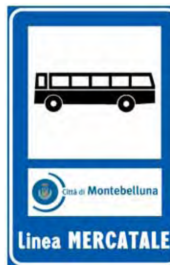
Per combattere lo smog confermato il servizio di autobus mercatale

Piano di Azione Comunale per la Tutela e il Risanamento dell'Atmosfera: un documento che contiene le azioni e i provvedimenti che l'Amministrazione intende realizzare per ridurre l'inquinamento dell'aria e che è stato sottoposto, per l'approvazione, alla Provincia di Treviso.