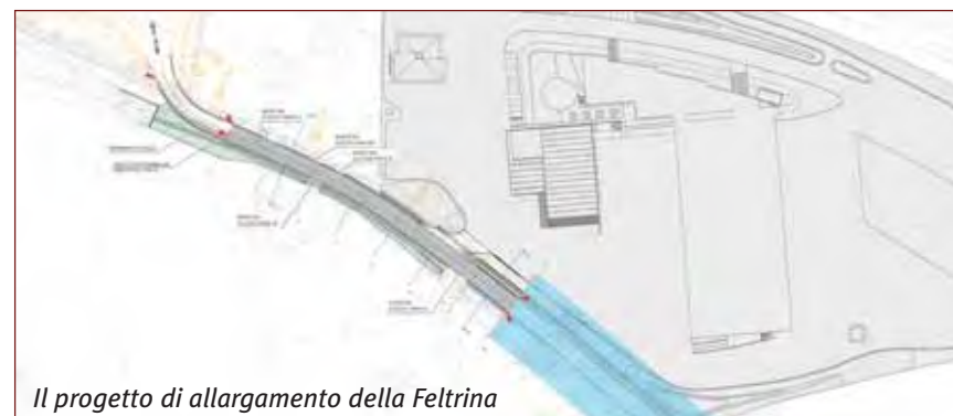
Il progetto di allargamento della Feltrina

Partiranno invece alla fine dell'estate 2008 i lavori di realizzazione della rotonda dei Pilastroni e dell'allargamento della Feltrina Vecchia. Interventi che l'Amministrazione Comunale ha deciso di unificare in un unico progetto in modo da evitare ripetizioni di procedure progettuali che avrebbero portato ad un allungamento dei tempi di realizzazione delle opere oltre che a costi maggiori. I lavori, per cui sono stati stanziati complessivamente 1.050.000 euro, consistono nella realizzazione di una rotonda all'intersezione tra la Feltrina e la Schiavonesca - Marosticana, e nell'allargamento del tratto di Via Feltrina Vecchia che va dall'attuale incrocio ai Pilastroni fino alla nuova sede della ditta Autotrasporti De Bortoli, in costruzione lungo la strada che va verso la chiesetta delle "Crozzole".