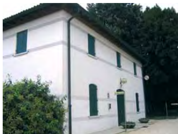
La Barchessa di Parco Manin ospiterà la sede dello I.A.T.