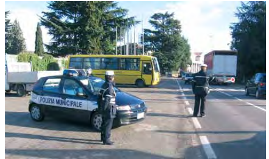
Con la riorganizzazione la Polizia Locale si coordina direttamente con il dirigente dei Lavori Pubblici

Si stanno inoltre verificando, con il perso-