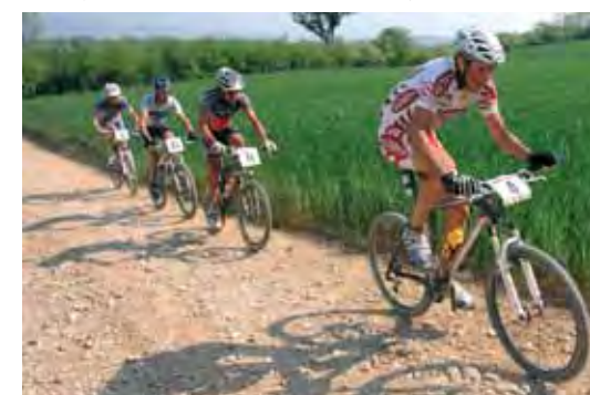
... un momento della gara

Promosso dall'Assessorato allo Sport in collaborazione con la società sportiva Pedali di Marca e agenzia Frontiere, il programma valorizza la naturale vocazione alle due ruote del nostro territorio.