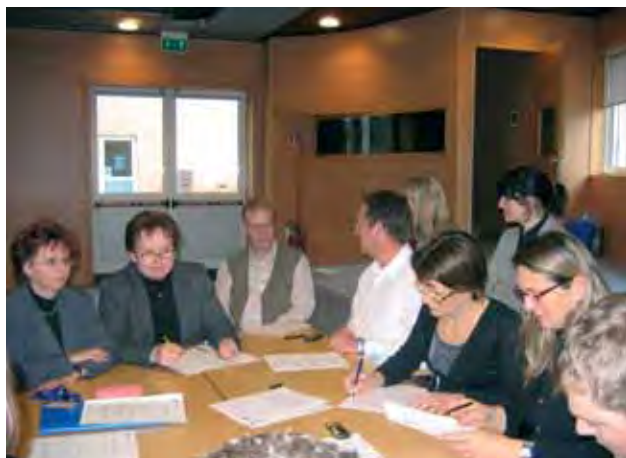
La firma della convenzione

La convenzione, firmata dal Sindaco di Montebelluna e da quelli delle quattro città presenti all'incontro, prevede l'accoglienza reciproca di ragazzi di età compresa tra i 18 e i 25 anni per attività di stage presso i rispettivi uffici comunali. Nella convenzione si è stabilito anche che ogni città che accoglie i giovani fornisca loro vitto e alloggio e favorisca il loro inserimento lavorativo. I requisiti minimi richiesti per partecipare agli scambi è la buona conoscenza dell'inglese e una conoscenza almeno di base della lingua del paese ospitante. In questi giorni l'Informagiovani sta definendo le modalità, i criteri e i tempi per selezionare quei giovani che