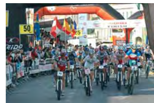
Gran fondo del Montello 2007: la partenza...