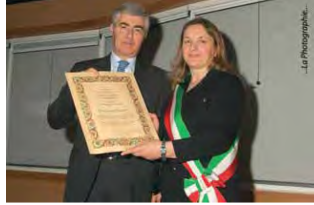
... e della pergamena ufficiale.

Il nuovo cittadino montebellunese è nato a Miglionico, in provincia di Matera, nel 1949, e, dopo essersi diplomato in ragioneria, ha iniziato la sua carriera al Credito Italiano, diventandone nel 1977, funzionario. Nel 1989 entra in Veneto Banca come capo area, diviene Direttore Generale nel 1997, e oggi ricopre la carica di Amministratore Delegato del gruppo Veneto Banca Holding S.p.A. Molte le motivazioni che hanno spinto l'Amministrazione Comunale a conferire la