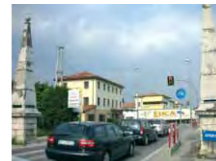
I due Pilastroni verranno restaurati

la massima sicurezza a pedoni e ciclisti la pista verrà separata dalla sede stradale da un'aiuola di protezione nella quale saranno piantati degli alberi a sostituzione di quelli che verranno abbattuti per eseguire i lavori. Sarà inoltre tombato il fossato presente e verrà predisposto un nuovo impianto di illuminazione lungo tutta la via. Nei 600.000 euro previsti invece per la realizzazione della rotonda ai Pilastroni è inclusa anche la spesa per il recupero dei due obelischi che sono simbolo e porta di accesso alla Città. Il restauro prevede, innanzitutto, il consolidamento dell'obelisco lesionato,