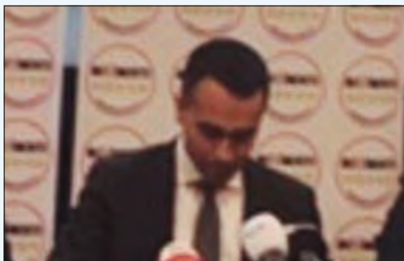
Luigi Di Maio, ieri a Matera

Con i social network più facile ricollocarsi