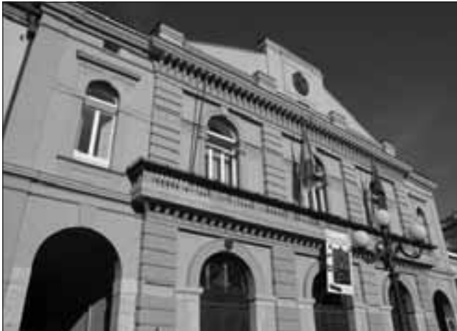
Il teatro cittadino intitolato a Francesco Stabile

MARCO Ranaldi, nelle conclusioni della sua pubblicazione su Francesco Stabile, ci ricorda che «la memoria della nostra terra è spesso poco attenta a ricordare coloro che l'hanno resa importante» e che «la figura e l'opera di Francesco Stabile sono completamente cadute nell'oblio». Oltre «alla Palmira della neonata Casa Ricordi, quello che resta dello Stabile è inedito o quasi del tutto ineseguito». E riporta il monito di Luigi Ricotti: «Le note musicali del maestro Stabile, le sacre in prima linea, che sono quelle della Via Crucis, delle salutazioni al Sangue di Cristo (...) sono di gran pregio e colpa ne avranno gli eredi se non si daranno pensiero di pubblicarle (...) in tal modo essi per premio avranno la soddisfazione di aggiungere altra aureola sulla fronte già redimita dell'illustre artista, il quale è gloria di Potenza». E allora, con Marco Ranaldi, se «il valore dell'opera di Francesco Stabile è sicuramente indiscusso, ora è importante eseguire e pubblicare la sua musica».