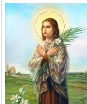
Santa Maria Goretti Vergine e martire